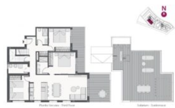
Apartment - Type E - 3 bedrooms + 2 baths + terrace Apartment - E Type - 3 bedrooms + 2 bathrooms + terrace