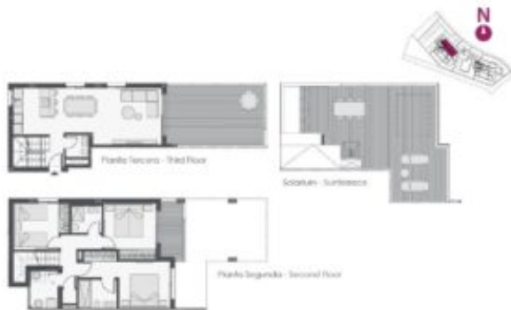
Apartment - Type D - 3 bedrooms + 3 baths + terrace Apartment - D Type - 3 bedrooms + 3 bathrooms + terrace