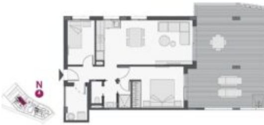
Apartment - Type A - 2 bedrooms + 1 bath Apartment - A Type - 2 bedrooms + 1 bathroom