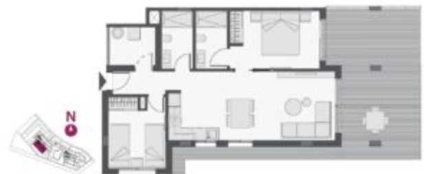
Apartment - Type B - 3 bedrooms + 2 baths Apartment - B Type - 3 bedrooms + 2 bathrooms