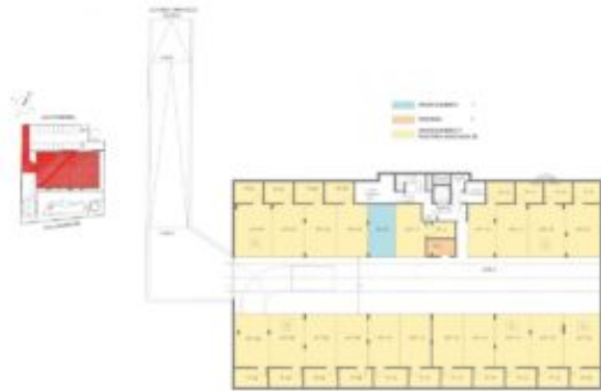
APARTMENT PARKING PLAN